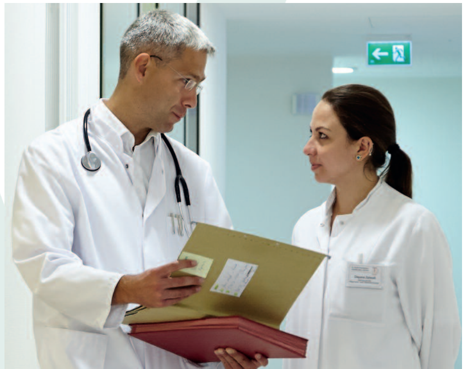
Rundum-Sorglos-Paket für angehende Allgemeinmediziner: Mit einem Weiterbildungsverbund wollen Hausärzte und Krankenhäuser in Paderborn die Facharztausbildung einfacher und attraktiver machen.

Info und Bewerbungen unter www.allgemeinmediziner-werden.de